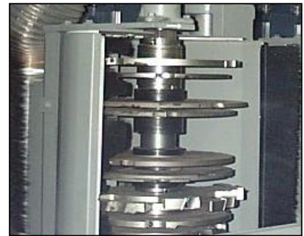
Op de lange as van 545 mm kunnen meerdere gereedschap sets geplaatst worden.