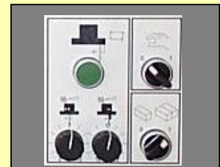
Automatische tafelbeweging met meerdere snelheden