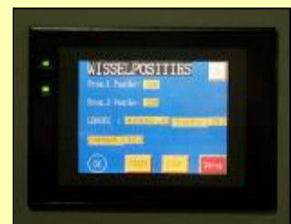
C.N.C. sturing met touchscreen bediening