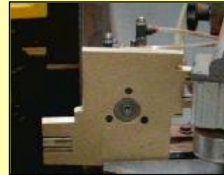
Pneumatisch rond contra-hout met 2 automatische posities