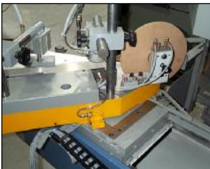
De tafel kan van -60^{\circ} tot +60^{\circ} gedraaid worden. Het oplegvlak verandert hierbij niet.

De Pentho Standard 3 is uitgevoerd met twee lange assen en een geluidsarme afkortzaag. Door middel van gereedschapsdeling kunnen de gereedschappen op alle assen met elkaar gecombineerd worden. De machine is voorzien van een horizontale tafelgeleiding en kan hout bewerken tot 185 mm houthoogte! De robuuste tafel is in twee richtingen 60 graden draaibaar voor schuin werk. Als veiligheidssysteem is een stofafstotend, doorzichtig scherm voorzien dat met de tafel meebeweegt en de machine volledig afsluit. De Pentho Standard 3 is met opties volledig te automatiseren.