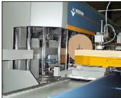
Het veiligheidsscherm schermt de volledige machine af. Standaard NC sturing machine