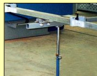
Extra ondersteuning lengte-aanslag voor langere lengtes