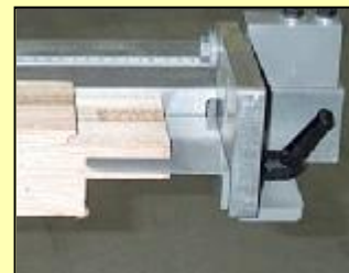
Grote aanslagen (dagmaat of 2 stukken tegelijk)