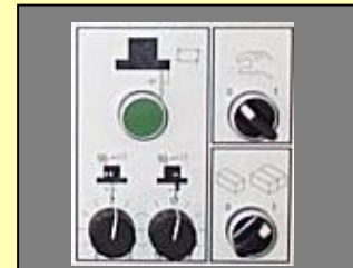
Automatische tafelbeweging met meerdere snelheden