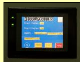
C.N.C. sturing met touchscreen bediening