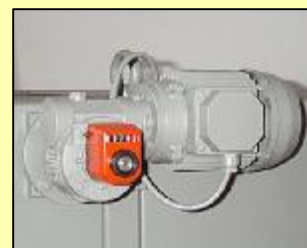
Motorische hoogte instelling aandrijver met dig. aflezing