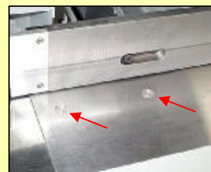
Luchtjets in de tafel