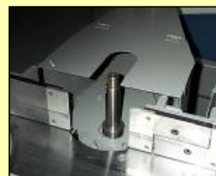
Bijvalas. 2,2 kW 105 mm