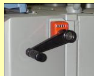
Hoogte instelling aandrijver met digitale aflezing